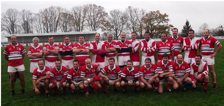
La sélection des Zabas'Boys.